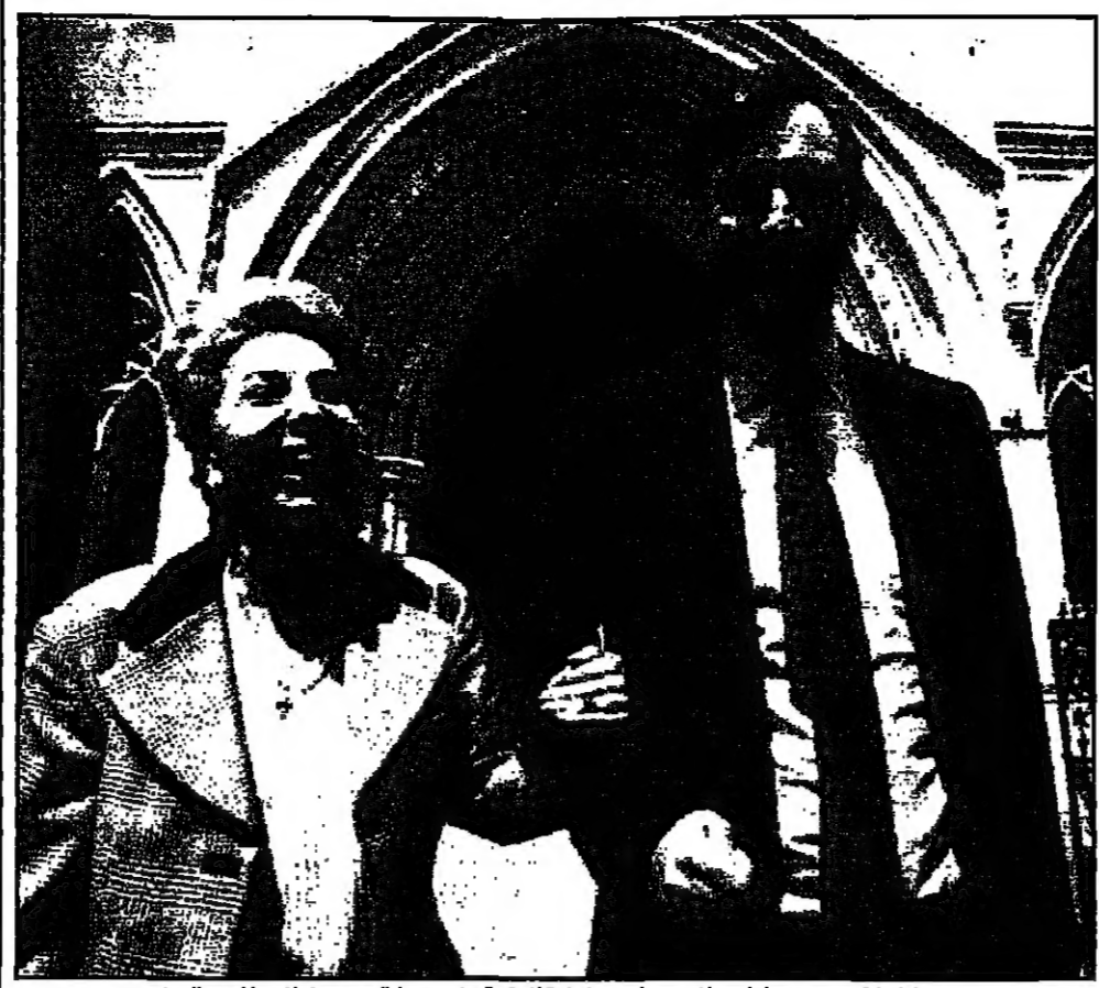
جوناثان اتكين وزوجته اوليسيا ادى مغادرتها قاعة المحكمة قبل ستراف الدعوى واصلها انفصالهما

لندن - والقدس العربي: اصابت صفقات الاسلحة البريطانية امس اعراضها فيما يخص قضية الوزير البريطاني السابق جوناثان اتكين الذي اسقط دعوى القذف التي اقامها على صحيفة «الغارديان» وقناة «مير اندام» التلفزيونية المستقلة بسبب كشفها قبل عامين عن صلاته بتزوير عرب منذ السبعينات، وتحملها تكاليف القضية التي قدرت بنحو مليوني جنيه استرليني (3.2 مليون دولار). وكشفت اسبوعية «اللايف» ان اتكين الذي دخل سجن لملء وتير مشريات الدفاع ووزير الخزانة في عهد حكومة المحافظين السابق، كان استعفى من قبل القاضي حينما سئل عن لجة التحقيق الخاصة بصناديق الاسلحة للعراق قبل ايام من سفره الى باريس عام 1993 واسمته في فندق «ريتز» على حساب امير سعودي، وذلك لسماحة حول صفقات اسلحة خاصة بالسعودية.